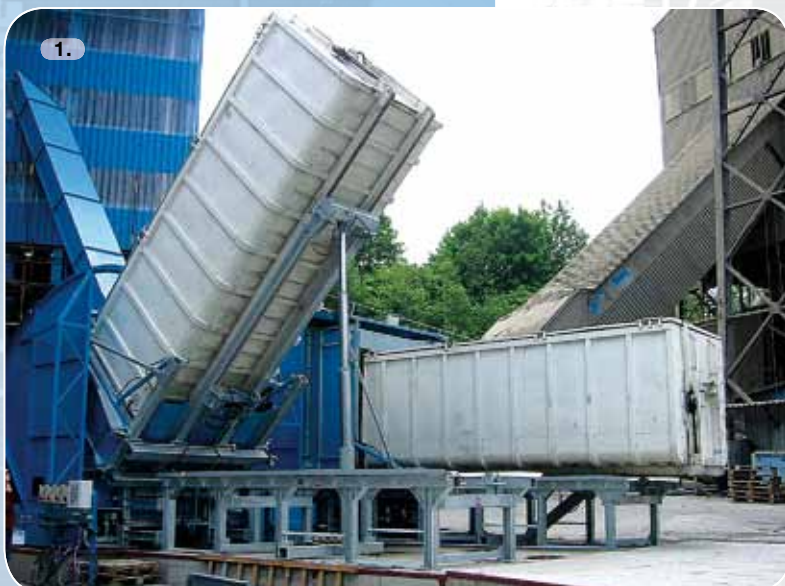
1. Příjmová stanice pro kontejnery a řetězový dopravník. Příjmová stanice se skládá z boxu, šnekového pole a plošiny s výklopným rámem. Materiál je vysypán z kontejneru do šnekového pole (viz. obr. 4) a následně dopravován řetězovým dopravníkem. Dvě stání.

Příjem a dopravu alternativních paliv zajišťují dopravní linky, z nichž některé byly vyvinuty ve spolupráci s firmou Schenck spol. s r.o. Praha. Alternativní paliva jsou dávkována buď pneumatickou dopravou do hořáků nebo mechanickou dopravou do paty pece. Dopravní linky se skládají z různých komponentů – viz následující obrázky.